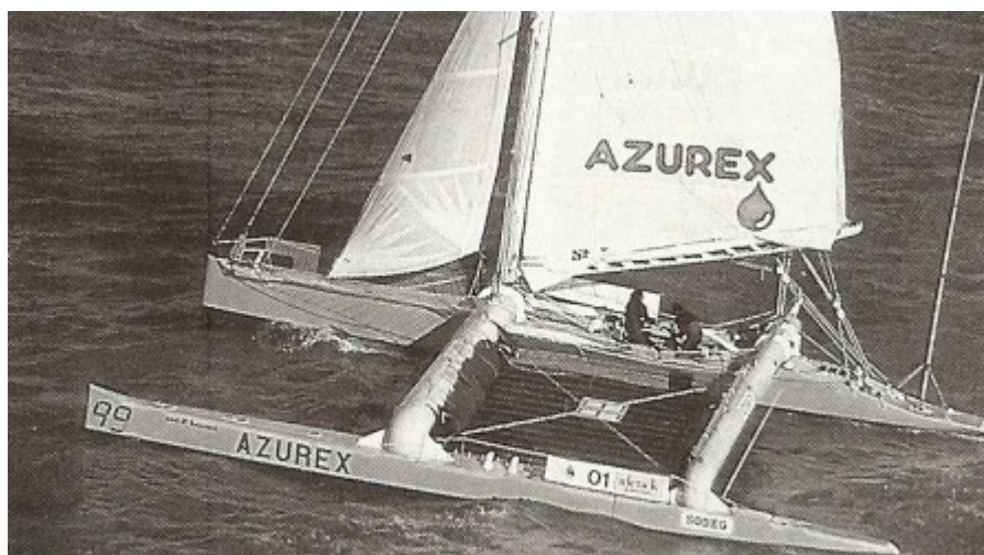
Aucun contact radio, ni signal Argos pendant plusieurs jours. On a pu craindre le pire pour l'équipe d'Azurex.